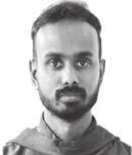
ഫാ.ആൽ മീൻ അമ്പാട്ടുപറമ്പിൽ